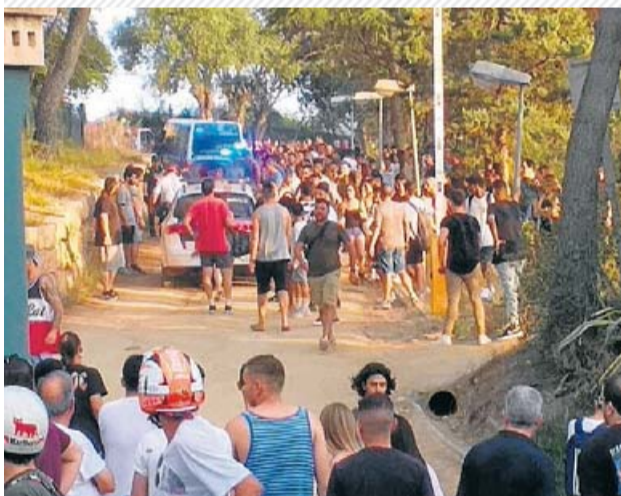
Un grup de veïns del Masnou van enfrontar-se a col·lectius antifeixistes que defensaven els 'menes'.

Aquests enfrontaments arriben unes setmanes després de situacions similars a Canet de Mar i Castelldefels. —