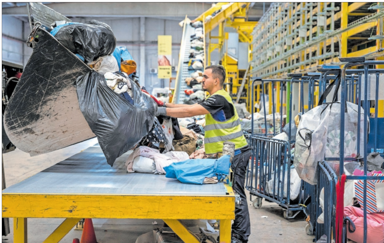
Un operario descargaba el día 10 ropa en la planta de tratamiento textil de Koopera, en Ribarroja de Turia (Valencia).

Habrán más contenedores y las marcas de moda tendrán que recoger prendas usadas y no podrán tirar sus excedentes