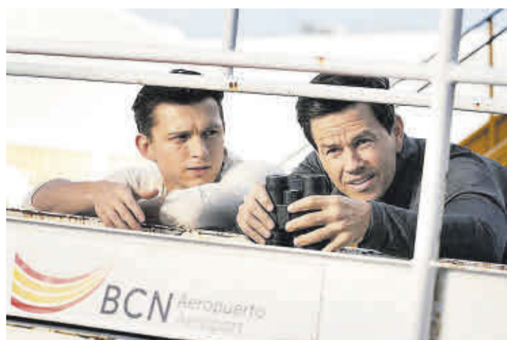
Una escena d' 'Uncharted' , amb Tom Holland i Mark Wahlberg.

La pròxima pel·lícula de Macaulay Culkin, Rich Flu , també va escollir Catalunya com a escenari el novembre de l'any passat. Barcelona, Sitges, Berga, Seva i Terrassa van acollir localitzacions de la producció del cineasta espanyol Galder Gaztelu-Urrutia després d' El hoyo , pendent d'estrena. I una de les escenes més rellevants de la temporada vinent de The crown es va rodar a Barcelona. La persecució i posterior mort de Lady Di es va traslladar fins als Jardins de Gràcia. Netflix va convertir Barcelona en París. ■