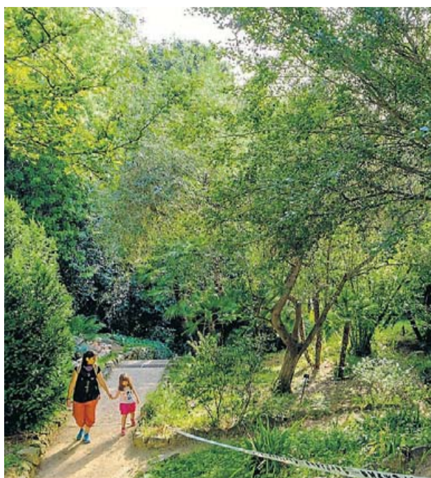
El Jardí Botànic, un espai verd protegit. MANOLO GARCÍA

interdisciplinària de la conservació del patrimoni natural, i que puguin abordar la valorització i gestió del mateix des d'un enfocament holístic. Els graduats d'aquest màster estaran capacitats per exercir una àmplia varietat de rols relacionats amb el coneixement i reconeixement del patrimoni natural i la gestió i la conservació dels recursos naturals, la preservació de la biodiversitat i la geodiversitat i l'educació ambiental. El perfil professional dels titulats permetrà treballar en