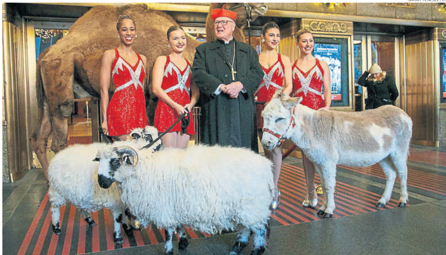
Històries nadalenques. Presentació de l'obra Living Nativity , protagonitzada per les Radio City Rockettes, el cardenal Timothy Dolan, un dromedari, dues ovelles i un ase, al Radio City Music Hall de Nova York