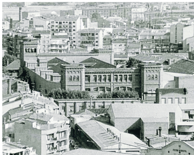
La Fàbrica Nova de Manresa a començaments dels anys noranta

L'Ajuntament va anunciar fa uns dies l'acord amb la propietat de la Fàbrica Nova per adquirir totes les propietats d'aquest complex de 65.000 metres qua-