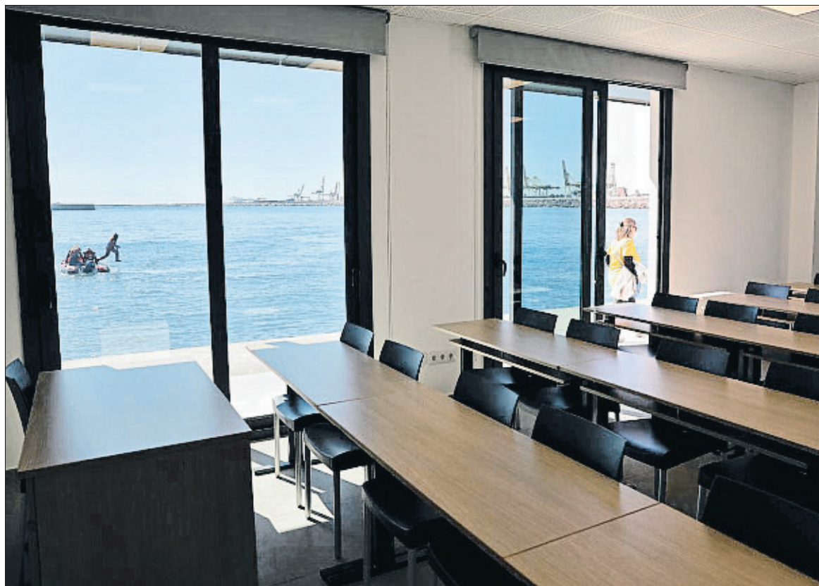
L'espai formatiu té accés directe a mar obert i una vista de somni

La creació d'un espai on s'asaboreix la sal del mar des de la cadira de la classe no és un invent nou a Barcelona. "Se'ns torna un espai reivindicat des de fa 30 anys", va assegurar Martín, que va recordar el club universitari on molts estudiants que ara es pentinen els cabells blancs van aprendre a navegar. Aquelles instal·lacions es van perdre primer pel canvi d'usos del port durant la transformació olímpica i després amb la remodelació dels molls de la Marina Port Vell.