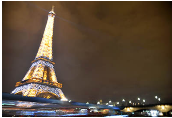
Fotografía finalista en la categoría Iluminación Paisajística y monumental.