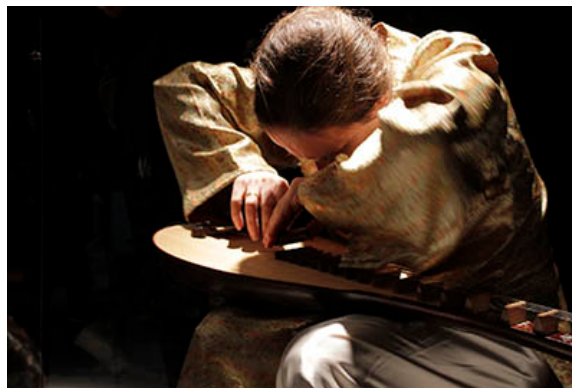
Fotografía finalista en la categoría Iluminación artística. Autora: Valeriya Rozbitska

Tras muchos preparativos para que todo salga perfecto, este jueves 26 de mayo a las 19 horas tendrá lugar una nueva cita en la Escuela Técnica Superior de Arquitectura de Barcelona. El motivo es hacer entrega de los premios a los correspondientes ganadores de la 2ª edición del Concurso Internacional de Fotografía de Luz Artificial (ICAL, en sus siglas en inglés), al cual este año se han presentado unas 300 fotografías . Además, como novedad ha incorporado una categoría especial para profesionales del sector de la iluminación, que ha tenido una exitosa afluencia de participación.