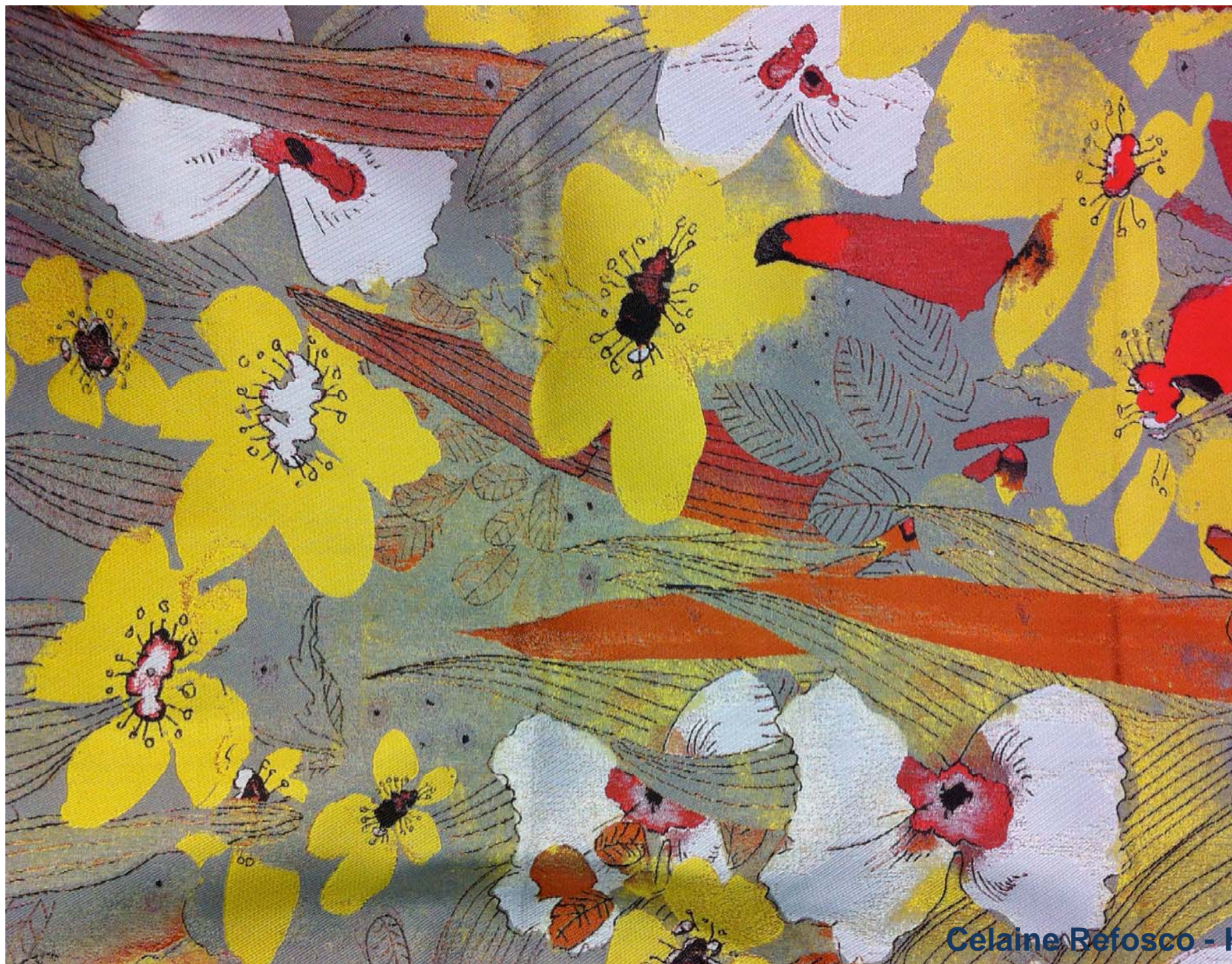
Celaine Refosco - H