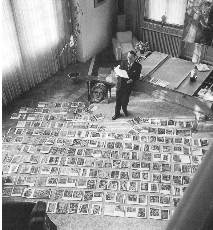
Le Musée Imaginaire_André Malraux_1947