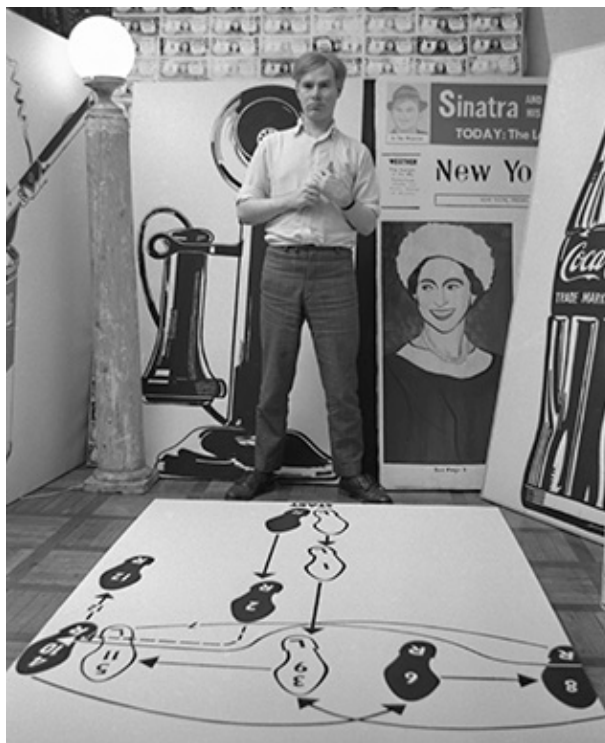
Dance Diagram 2. The double Twinkle, Andy Warhol, 1962