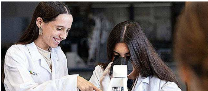
CEU FERNANDO III

La universidad más joven del País Vasco tiene un proyecto académico innovador, dinámico y orientado a los retos profesionales presentes y futuros. Su campus, en el anillo verde de Vitoria, alberga una institución especializada en nuevas tecnologías, deporte y salud, ámbitos que vertebran su propuesta de valor. Usa la metodología learning by doing .