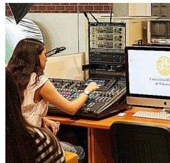
PONTIFICIA DE SALAMANCA

Primera universidad privada de iniciativa social en Andalucía, promovida por la Compañía de Jesús. Se integra en la red mundial de universidades jesuitas y destaca por un modelo educativo basado en la excelencia académica, la internacionalización y el humanismo cristiano. Para el curso 2025-26 ha reforzado su oferta tecnológica, con nuevos grados en Ingeniería Aeroespacial e Ingeniería Biomédica.