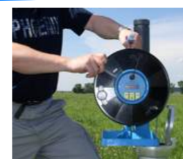
Monitoreo de aguas subterráneas