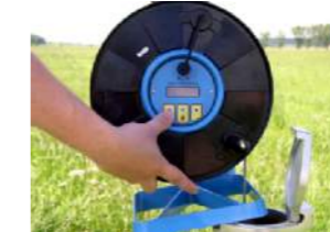
Ajuste del KLL-Q-2