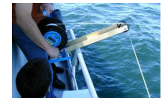
Toma muestras en aguas superficiales