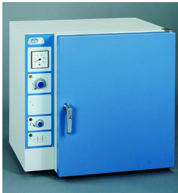
Modelos Conterm, códigos 2000208, 2000209 y 2000210.

CARACTERÍSTICAS, PANEL DE MANDOS, SEGURIDAD, NORMAS Y ACCESORIOS (ver págs. 180 y 181).