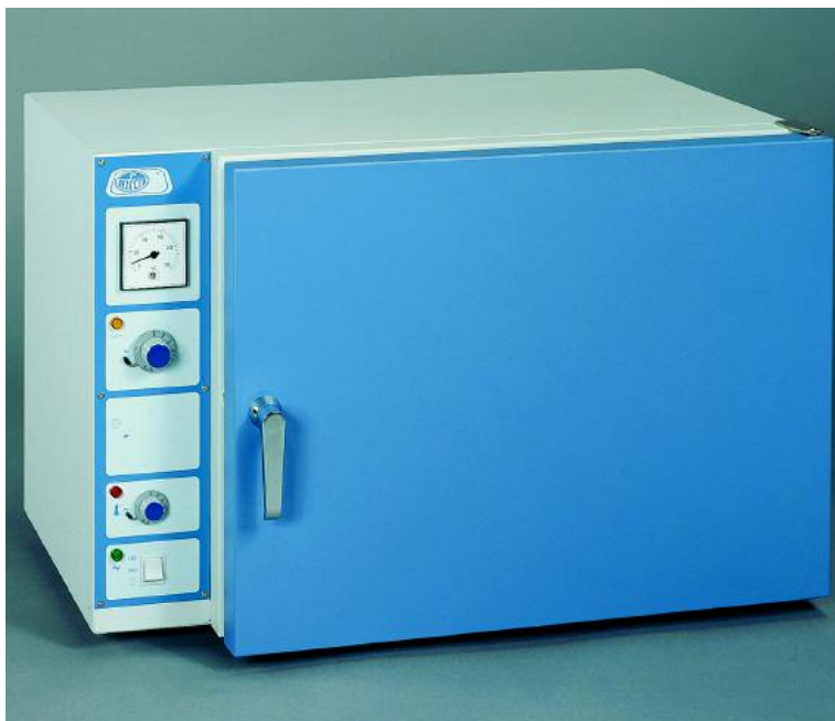
Modelo Conterm tipo Paupinel, códigos 2000200 y 2000201.