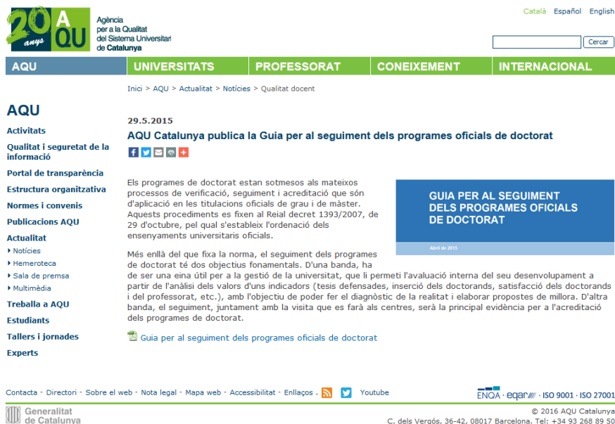
Imatge 4: Pantalla del web d'AQU Catalunya: Guia per al seguiment dels seguiments oficials de doctorat

Durant tot el període en que les unitats han estat treballant en l'anàlisi i elaboració de l'Informe, des del GPAQ se'ls ha ofert un servei de suport tècnic, assessorament i resolució d'incidències. Al final del procés s'ha elaborat i tramès als responsables de cada titulació un informe de revisió tècnica de l'ISPD amb una sèrie de recomanacions orientades a la millora del mateix.