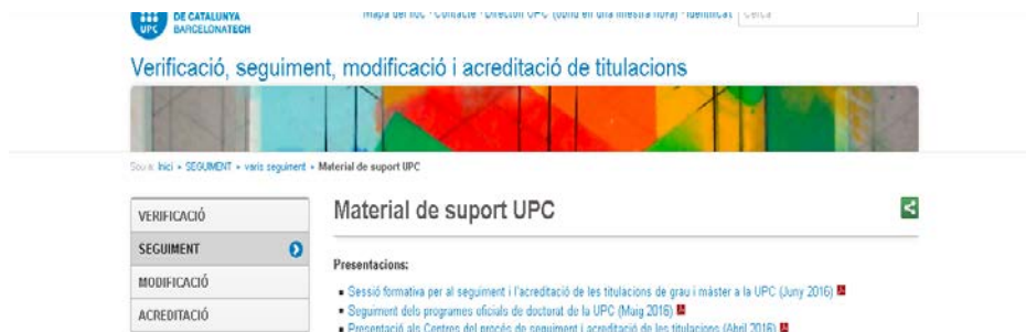
Imatge 3: Pantalla de l'apartat de material de suport del web Verificació, seguiment, modificació i acreditació de les titulacions de la UPC

El calendari per a la tramesa dels informes de seguiment de cada programa es va lliurar a l'esmentada sessió i, al respecte, en data d'avui, tots els programes han lliurat els seus informes (ISPD) basats en el Sistema de Garantia Interna de la Qualitat (SGIQ) de l'Escola de Doctorat. Els informes han tingut opció a la revisió tècnica de GPAQ abans de presentar-se en la data establerta.